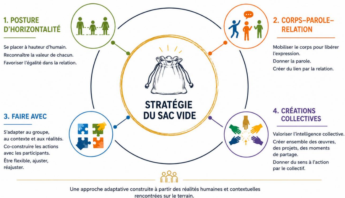
Figure 1 : présentation schématique de la méthode pédagogique, la « Stratégie du sac vide »

UNE APPROCHE ADAPTATIVE DE L'INTERVENTION ARTISTIQUE À VISÉE SOCIALE