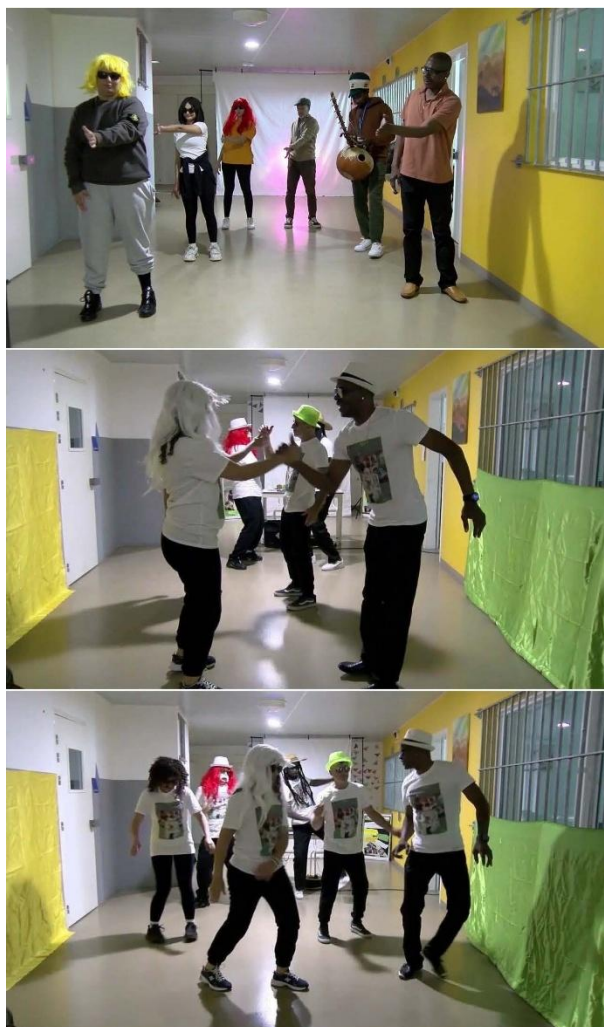
Figure 4 : photos montrant une séance de répétition du projet « A.C.T.-7 » et la restitution publique aux Baumettes

Les ateliers privilégiaient la mobilisation corporelle, la participation collective et la création d'espaces favorisant l'expression dans un contexte institutionnel fortement contraint.