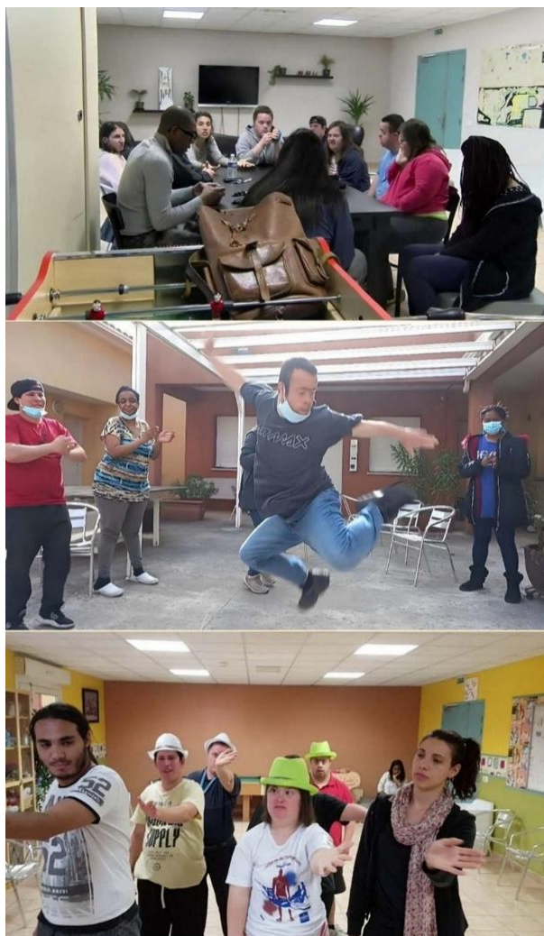
Figure 3 : Projet « A.C.T. au foyer » – Foyer « JAS La Bessonnère »

En haut : temps d'échange et de co-construction du projet avec les participants. Au centre : expression individuelle lors d'une séance en atelier. En bas : répétition collective en préparation d'une restitution artistique en extérieur.