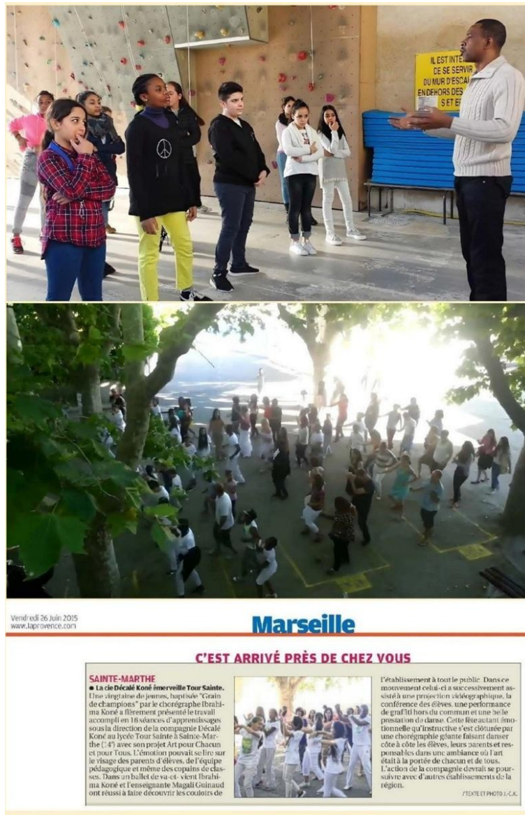
Figure 2 : photos résumant la réalisation du projet « A.C.T. à l'école » au Collège/Lycée Tour Sainte à Marseille.

En haut : séance d'atelier d'expression corporelle avec les élèves. Au centre : restitution publique dans la cour de l'établissement, réunissant élèves, enseignants et familles. En bas : article publié dans « La Provence » (26 juin 2015) saluant la portée éducative et artistique du projet « Art pour Chacun et pour Tous », mené par la « Cie Décalé Koné ».